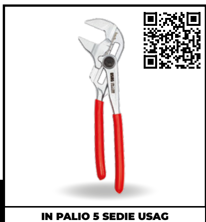
PINZA CHIAVE REGOLABILE 174 CX

Ideali per lavorare sia con bussole che con inserti in spazi ristretti come ad esempio pulegge e alternatori di automobili.