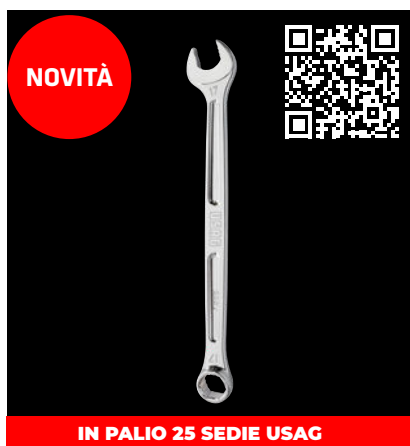
CHIAVI COMBinate 285 X

Puoi scegliere tra questi utensili: 25 delle 50 esclusive sedie USAG Racing saranno assegnate a chi girerà il video con la nuova chiave 285 X .