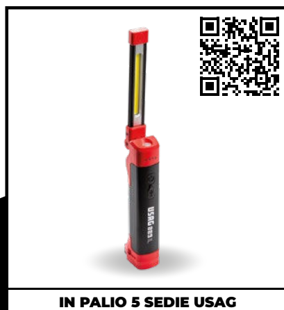
LAMPADA ISPEZIONE LED SNODATA 889 IL

È l'utensile che tutti gli idraulici dovrebbero avere nella propria cassetta degli attrezzi. Permette di serrare, tenere fermo, schiacciare e piegare.