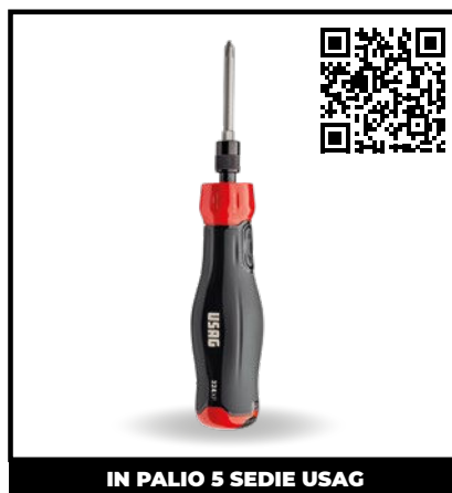
GIRAVITE ELETTRICO 324 XP

È l'utensile ideale per serrare o svitare qualsiasi dado, anche il più danneggiato.