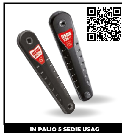
PROLUNGHE A CATENA 236 K - 236 KE

Avviti e sviti velocemente. Finisci il serraggio delle viti, grazie alla sensibilità del tuo polso.